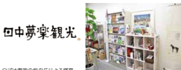
ロゴは書家の紫舟氏による揮毫