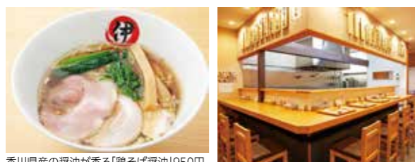
香川県産の醤油が香る「鶏そば醤油」950円