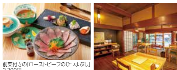
前菜付きの「ローストビーフのひつまぶし」2,200円