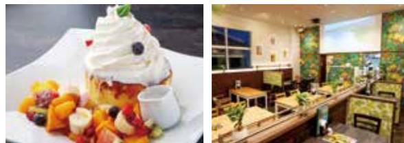
季節のフレッシュフルーツパンケーキ1,700円 ハワイにある小さなカフェをイメージした陽気な店内