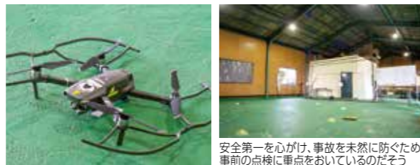
安全第一を心がけ、事故を未然に防ぐため事前の点検に重点をおいているのだそう