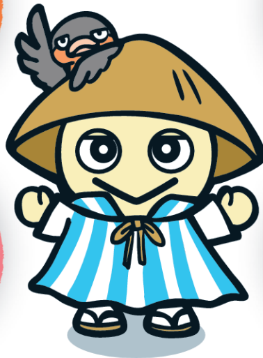
公式キャラクター さぼじろー&ぶり兄